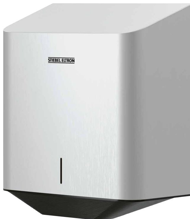
ULTRONIC PREMIUM ist in einem hochwertigen Edelstahlgehäuse gearbeitet.