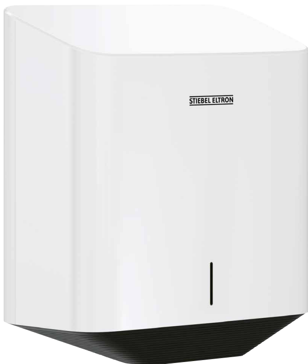
ULTRONIC PLUS besticht nebst der besonders kurzen Trocknungszeit durch sein robustes, schlagfestes Kunststoffgehäuse

Die Bedienung erfolgt berührungslos durch die integrierte Infrarot-Näherungselektronik. Für zusätzliche Hygiene sorgen der HEPA-Filter und die Luftreinigungsfunktion durch UV-C-Licht und Ionengenerator. Das Gerät entfernt zuverlässig Staub, Pollen, Bakterien und Viren aus der Raumluft. Ein zuschaltbares Heizelement steigert den Komfort beim Händetrocknen. Dank des «Silent Mode» optimal geeignet für Sanitärräume in Schulen und Büros. Die besonders geringe Anschlussleistung ermöglicht einen energieeffizienten und umweltschonenden Einsatz. Das robuste und schlagfeste Gehäuse besteht beim ULTRONIC PLUS aus Kunststoff und beim ULTRONIC Premium aus Edelstahl.